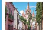
San Miguel de A...